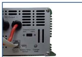
《モード切替スイッチ》